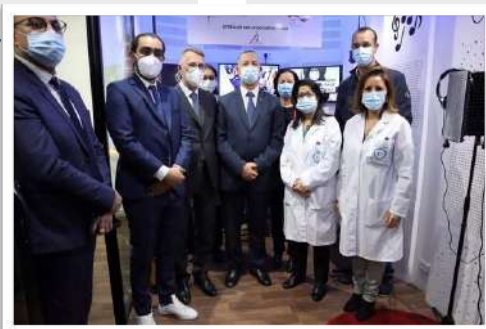
Ministère de la santé sur Facebook

La Fédération Française de musico-thérapie définit « La musicothérapie comme une pratique de soin, de relation, d'aide, d'accompagnement, de soutien ou de rééducation, utilisant le son et la musique, sous toutes leurs formes, comme moyen d'expression, de communication, de structuration et d'analyse de la relation. » Cette thérapie peut être utilisée dans le cadre éducatif, les écoles notamment, dans le cadre social ou bien dans le milieu médical. C'est ce dernier domaine que nous approfondirons.