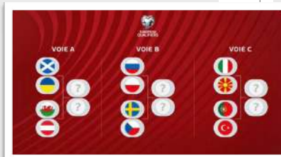
@euro2024rfa sur Twitter

La composition de celle-ci a d'ailleurs été tirée au sort le 26 novembre.